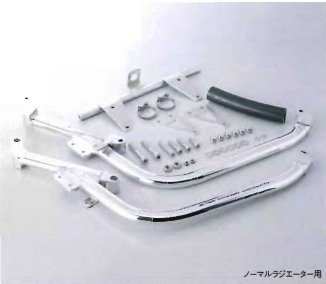
ノーマルラジエーター用