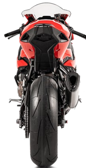
Optional Heat shield (Carbon) (別売オプション)