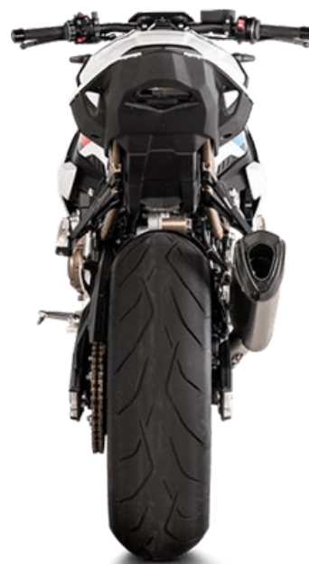
Optional Heat shield (Carbon) (別売オプション)